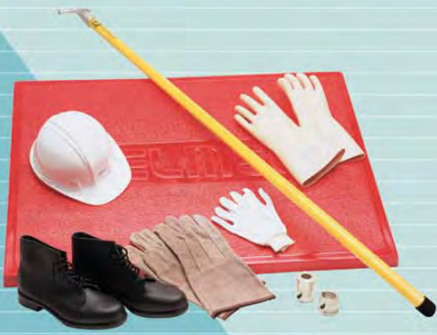
Paquete de seguridad personal