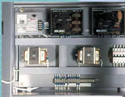
Cargador de baterías/sensitivos de voltaje

Estamos con usted desde la instalación, el arranque y mantenimiento de su planta. Además, le ofrecemos el servicio de mantenimiento preventivo y/o correctivo. ¡¡LAS 24 HORAS LOS 365 DÍAS DEL AÑO !!