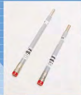
Fusible de potencia SMU-20

En esta gama de productos, Selmelec le ofrece el servicio de mantenimiento preventivo y/o correctivo, así como las refacciones que su equipo requiera para el perfecto funcionamiento de la subestación.